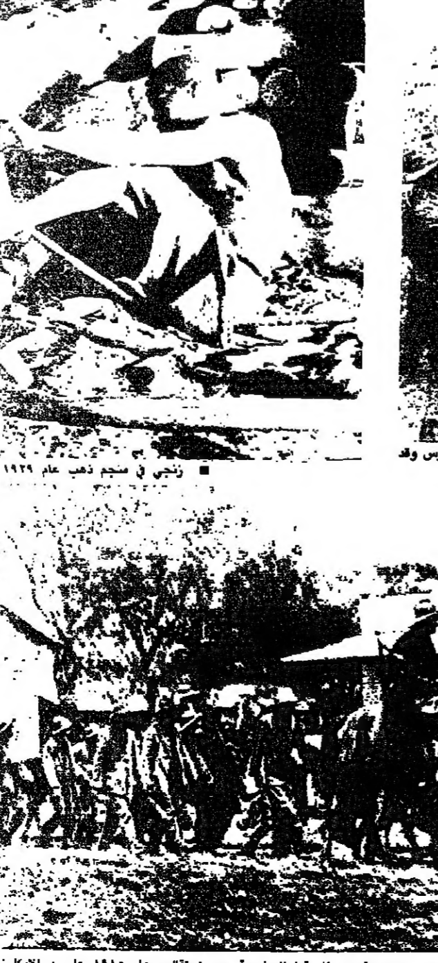
مقاتل من البويرس، على حصانه عام ١٩٠٠ الهولنديون يداينون في جنوب الريفيقا